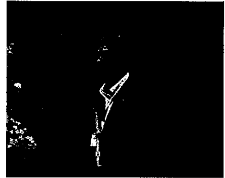
平成29年度 役員紹介