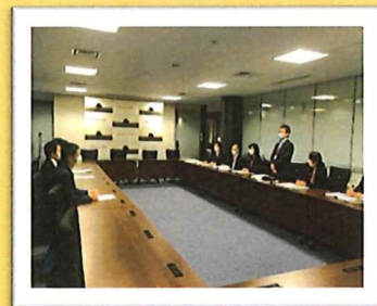
市担当課との意見交換会

この度の活動を通して、出雲市及び出雲市議会が、私たち子育て世帯と違う方向を向いているのでは無いという事を実感しました。当連合会としましては、これらの取組がさらに進み、より良い子育て環境になっていくよう、今後も陳情・要望活動に取り組んでいきたいと考えます。