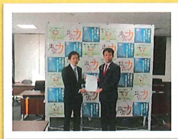
出雲市長へ陳情書提出

出雲市認可保育所（園）の保護者の皆様にご協力いただいたアンケートを基に作成した要望書と陳情書を2022年11月15日出雲市役所にて、出雲市長と出雲市議会に提出いたしました。