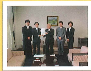
出雲市議会へ陳情書提出