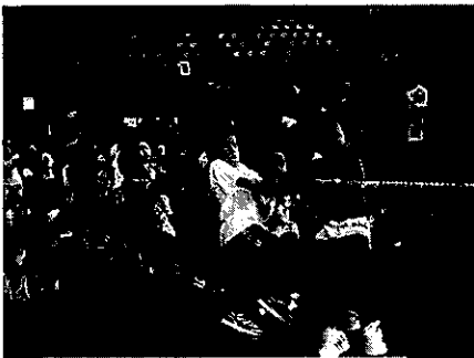
エキシビジョンマッチ