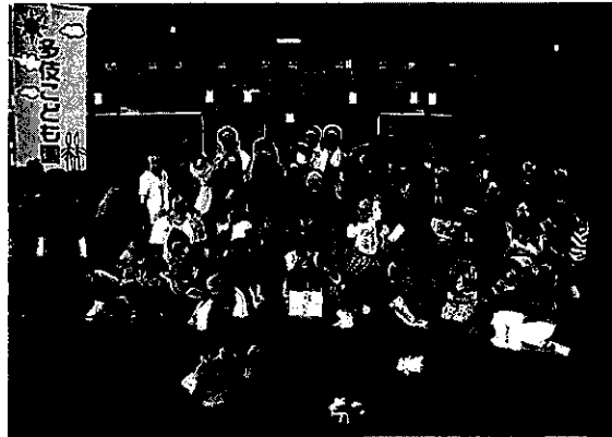
優勝した多伎こども園の皆さん おめでとうございます！