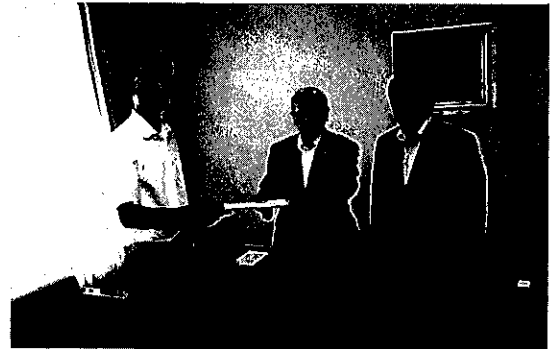
出雲市議会 議長・副議長へ提出